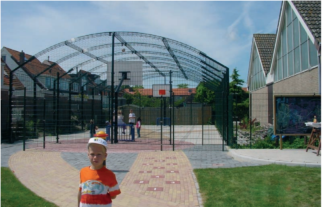
Speeltuinen bieden steeds vaker sportmogelijkheden voor jongeren

speel- of sportterrein. Een tijdelijk beheerteam uit de buurt en een klein budget van de gemeente zijn toereikend. De feitelijke inrichting van het terrein gebeurt door bewoners en jongeren zelf. In plaats van een afgesloten braakland ontstaat er een tijdelijk speelterrein en een netwerk van betrokken buurtbewoners.