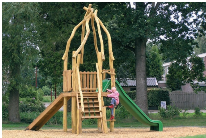
Fantasie als basis voor speelruimte in Heerenveen