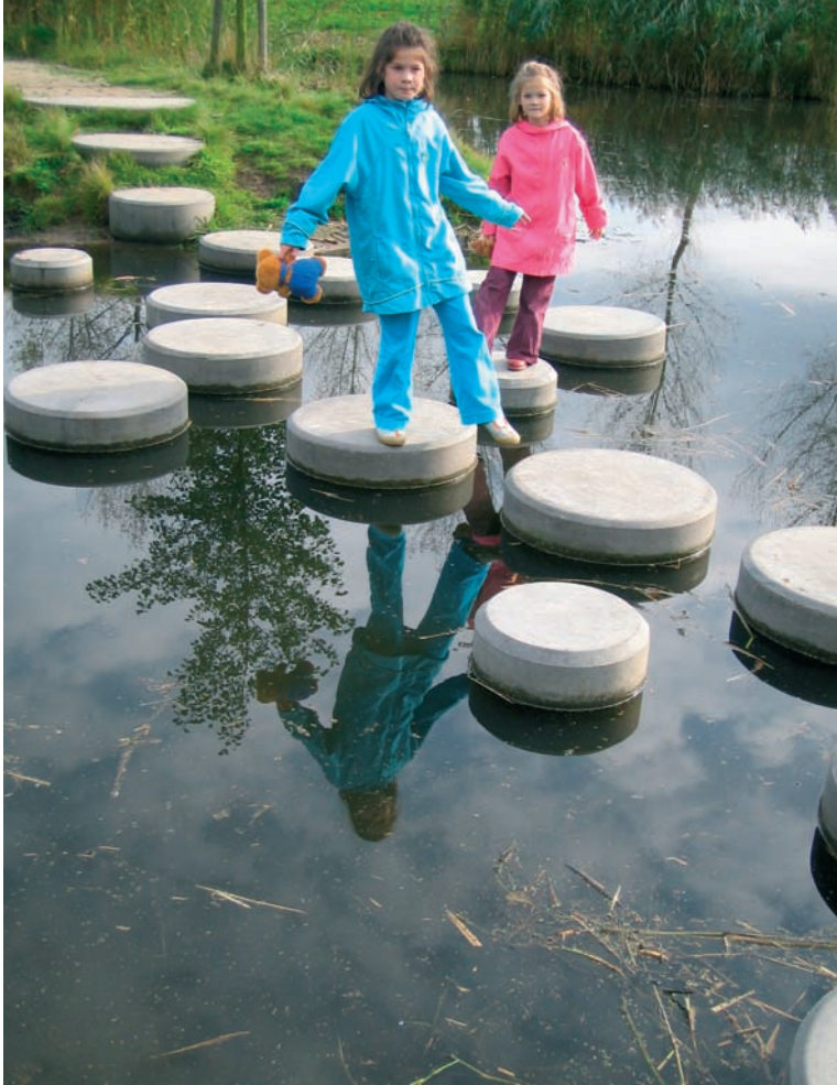
Fraaie combinatie van waterberging en speelruimte

onbruikbaar voor de jeugd. Regels voor honden zijn noodzakelijk om de bespeelbaarheid van de woonomgeving te vergroten. Suggesties zijn: