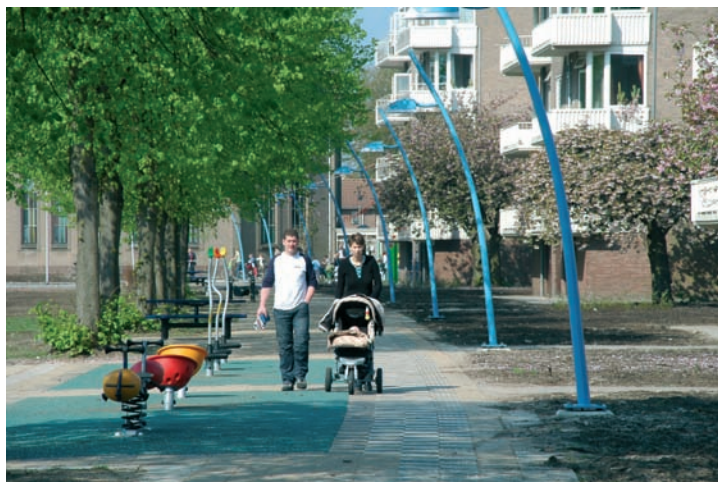
Succesvolle aanpassingen in een naoorlogse hoog- bouwwijk

zijn. In de bochtige straten zien automobilisten en kinderen elkaar pas op het laatste moment. De situatie kan vaak worden verbeterd door een kindertrefpunt te maken. Een plek waar parkeren wordt uitgesloten, voorzien van een bankje, een of twee speeltoestellen en een basketbalpaal, is vaak al genoeg. Zo'n plek biedt even vertier, in afwachting van andere kinderen. Ook wat grotere plekken, waar bijvoorbeeld ruimte is om een balletje te trappen, kunnen welkom zijn.