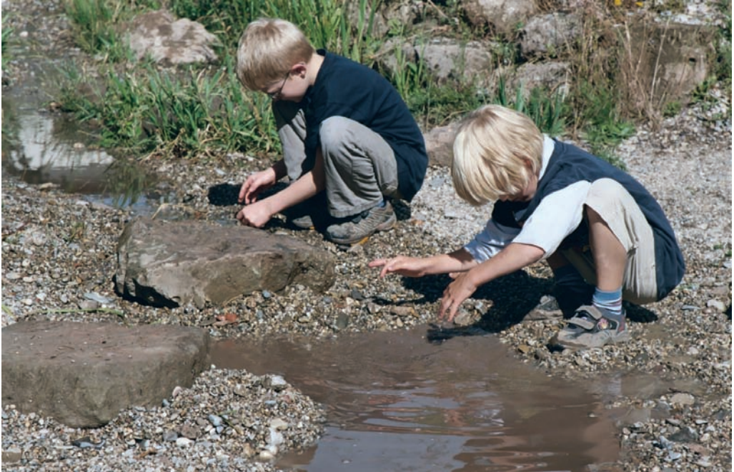
Veilig spelen met water

dige handpomp, watergoten en waterbakken. Een open regenwaterafvoer, verbonden met een wadi, vormt een prima waterspeelplaats. Iedere dag is het anders: nat, droog of modderig. De veiligheid van open water kan worden vergroot door gebruik te maken van flauwe taluds en goede zichtbaarheid.