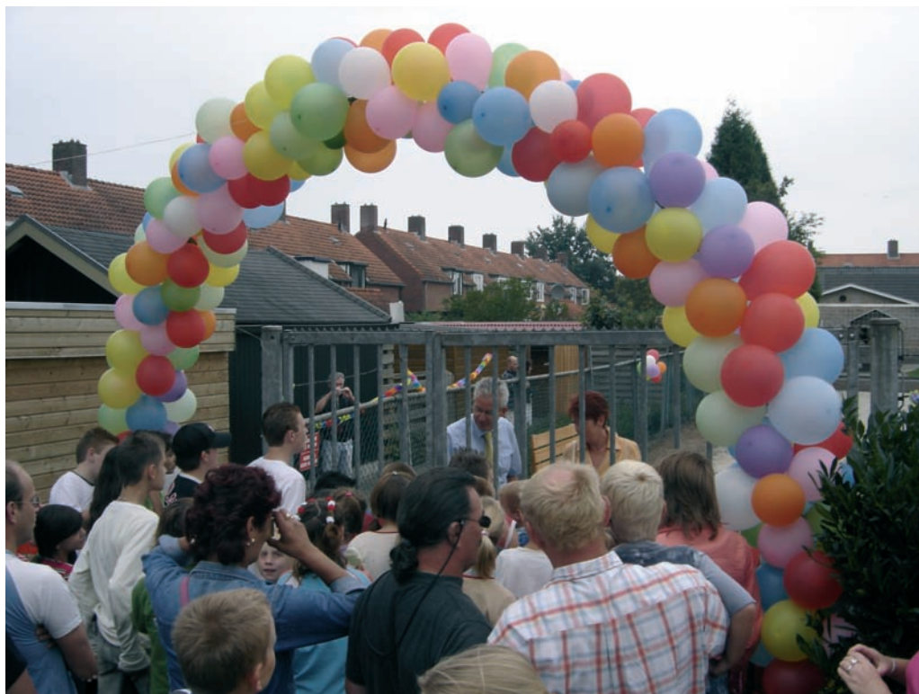
Speeltuín wordt na de renovatie feestelijk geopend

gels Nederland en het VSB Fonds. Zie verder www.samenbuitenspelen.nl .