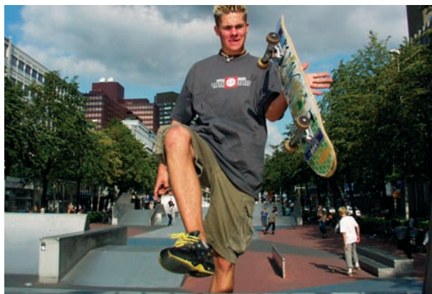
De stad als speelveld voor jongeren