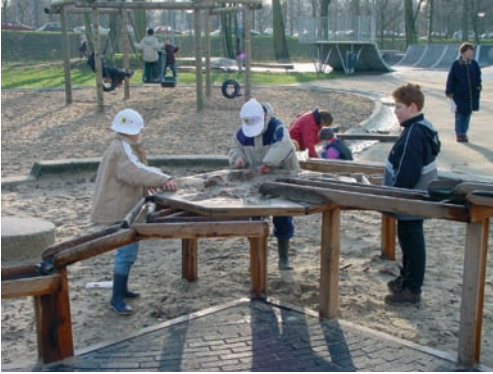
Spelen met zand en water op hoogte zodat dit ook toegankelijk is voor kinderen in een rolstoel

jongeren met een visuele beperking aantrekkelijk. Langs een extra brede glijbaan (met rolstoeloprit) kunnen ook anderen in groepjes naar beneden roetsjen.