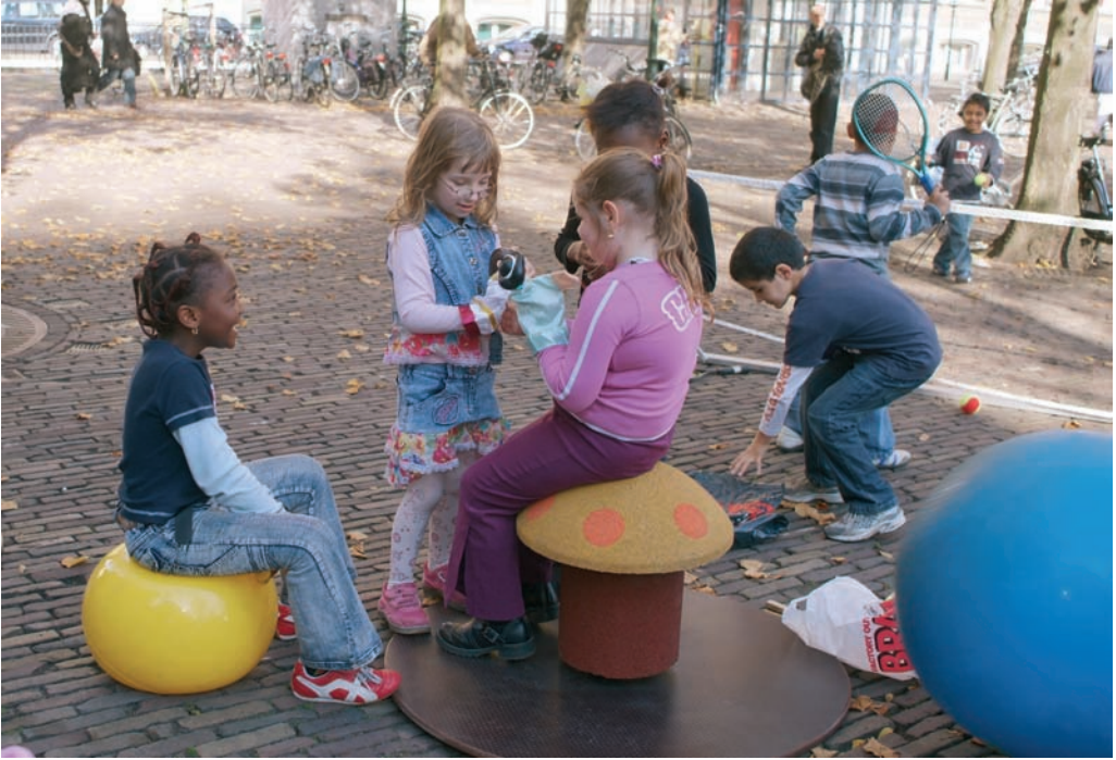
Spelen op straat; kinderen mogen er zijn

vierkante meters nodig. Om voldoende ruimte te waarborgen, hebben sommige gemeenten zelf een speelruimtenorm vastgesteld. Het ministerie van VROM beveelt aan om minstens 3 procent van nieuwe uitleglocatie te reserveren voor speelruimte (zie ook paragraaf 5.1).