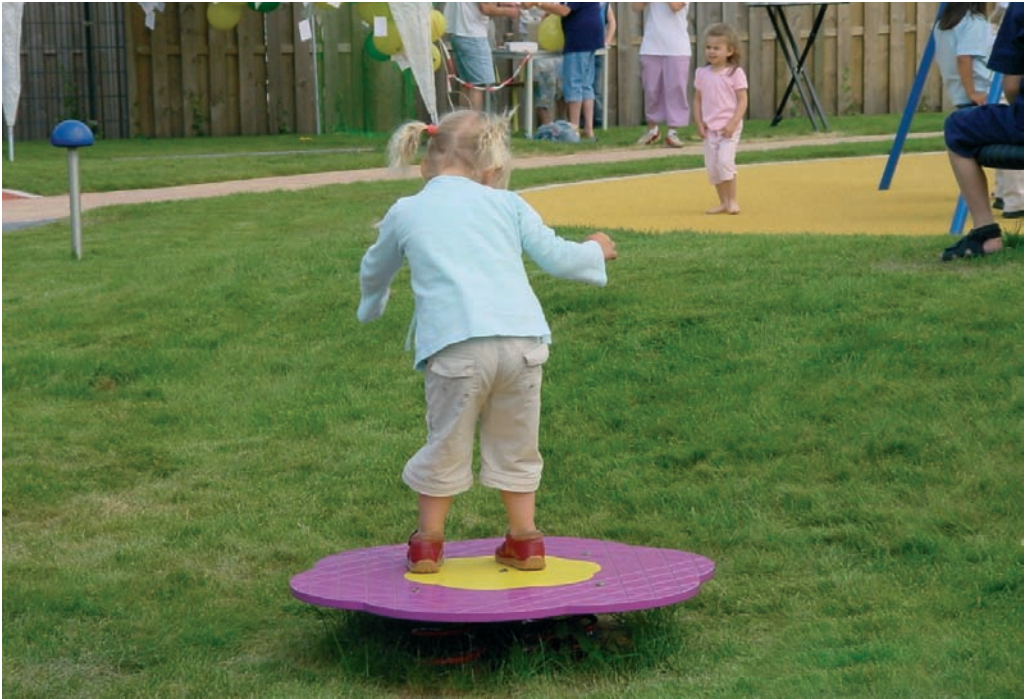
Kleine speelplek dicht bij huis

van huis of kinderopvang is prettig. In wijken met weinig informele speelmogelijkheden is dat zelfs noodzakelijk. Oppervlakte 100 tot 500 m 2 .