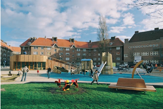
Inrichting speelplein voor alle leeftijden

biedt de mogelijkheid voor kinderen en jongeren om in gezinsverband buiten te spelen. Meiden maken dan ook sneller gebruik van dergelijke plekken en er is minder kans dat een concentratie grote jongens de plek domineert. De leeftijdsopbouw van een wijk kan door de jaren heen bovendien flink fluctueren. In nieuwbouwwijken is dat het duidelijkst zichtbaar. Na vijf jaar een sterke groei van het aantal peuters, na vijftien jaar een wijk vol jongeren en weer tien jaar later wordt het stil op straat. Er zijn verschillende manieren om hierop in te spelen.